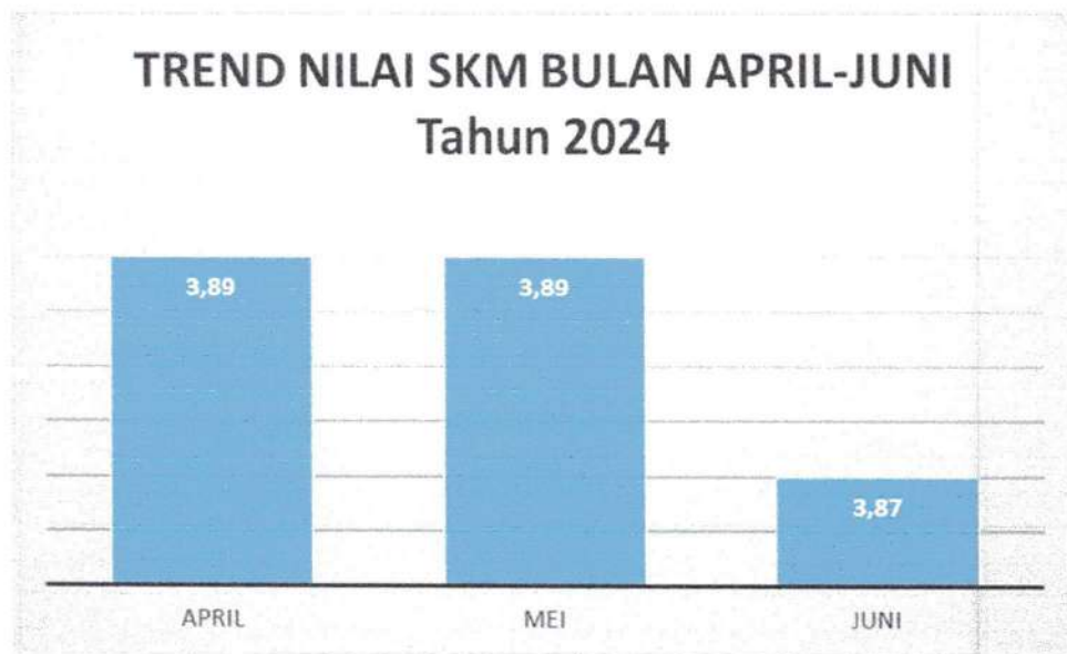
Grafik 2. Tren Nilai SKM

Berdasarkan tabel di atas, dapat disimpulkan bahwa terjadi konsistensi kinerja penyelenggaraan pelayanan publik dari bulan April dan Mei pada unsur Persyaratan (U1), Sistem, Mekanisme, dan Prosedur (U2), Waktu Penyelesaian (U3), Biaya/Tarif (U4), Produk Spesifikasi jenis pelayanan (U5), Kompetensi pelaksana (U6), Perilaku pelaksana (U7), Penanganan Pengaduan, Saran dan Masukan (U8), Penanganan Pengaduan, Sarana dan Prasarana (U9), akan tetapi terjadi penurunan nilai pada bulan Juni 2024.