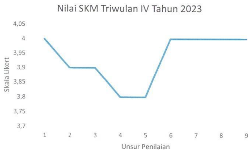
Gambar 1. Grafik Nilai SKM Per Unsur